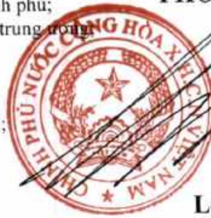
Lê Văn Thành

TM. CHÍNH PHỦ KT. THỦ TƯỚNG PHÓ THỦ TƯỚNG